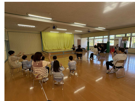
幼稚園での保護者向け運動教室