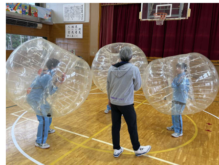
学校でのニュースポーツ体験会