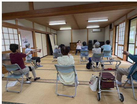
元気アップ運動認定指導者 による運動教室